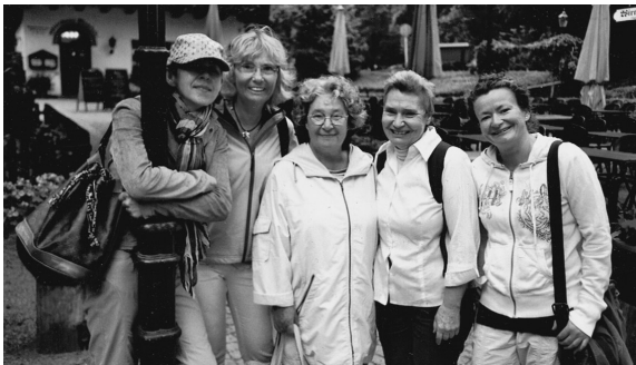
Die Damen unseres Elisabethkreises unternahmen am 27.8. einen schönen Tagesausflug an den Wannsee.